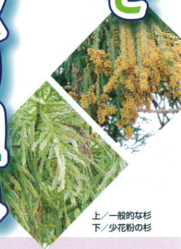
上/一般的な杉 下/少花粉の杉

花粉症のない健やかな社会を目指して スギ・ヒノキ花粉削減の取り組み 森林・林業における