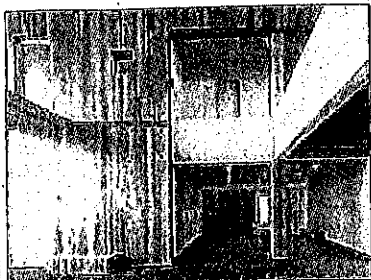
構造部材を「あらわし」としている 高知県森連会館 (2階建の事務所*)